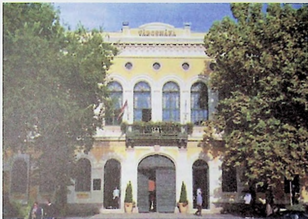
Békéscsaba - városháza

létrejöttek az első üzemek is. A textilipar gyárai mellett nyomdák sora, bútorgyár, malmok, kocsigyár, majd a XX. század elején betongyárak is alakultak. A gazdaság virágzása magával hozta a város szépülését is. Új épületek sora emelkedett, amelyek igazán méltók voltak a városhoz.