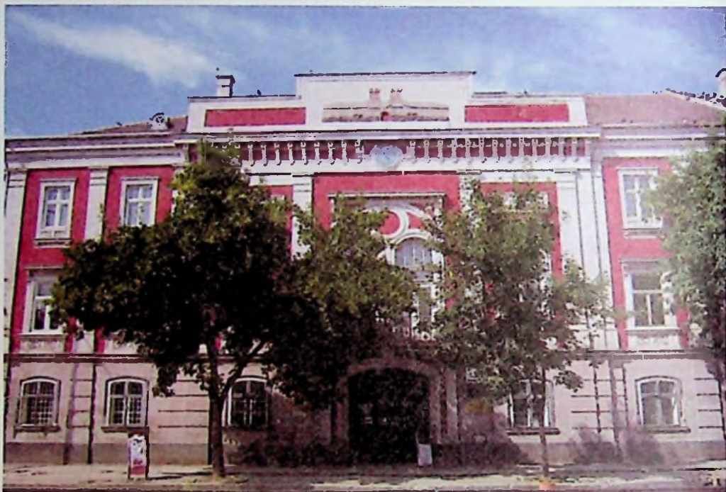
Temesvár – óvárosháza

Többszöri visszahódítási kísérlet után, Savoyai Jenő 1716-ban beveszi a várat, ezáltal Temesvár több mint 200 évig tartó osztrák, majd magyar fennhatóság alá kerül. 1716-1778 között az egész Bánság és a temesvári vár a császári fennhatóság alá tartozik. 1716-1755 között a közigazgatás katonai, majd 1778-ig polgári. 1779-ben a Bánság a magyar királyság részévé válik.