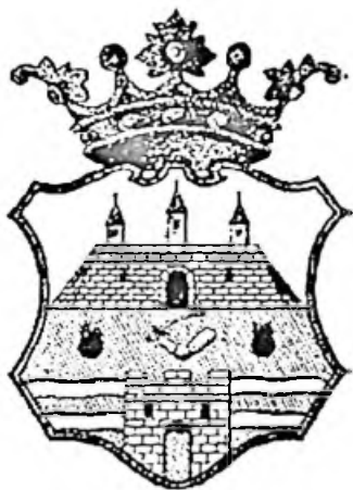
Arad - régi címer

A XVIII. században kezd fokozatosan fejlődni a város, kialakulnak a céhek, növekszik a város lakossága, ide telepedik a Ferenc-rendi minorita rend. A fejlődésnek köszönhetően felépül a városháza, majd pedig a minoriták barokk stílusú temploma. A török hódítás idején épült várat egy újra cserélik, melyet Mária Terézia rendeletére Vauban stílusban építetik fel. Ez a jelenleg is létező aradi vár.