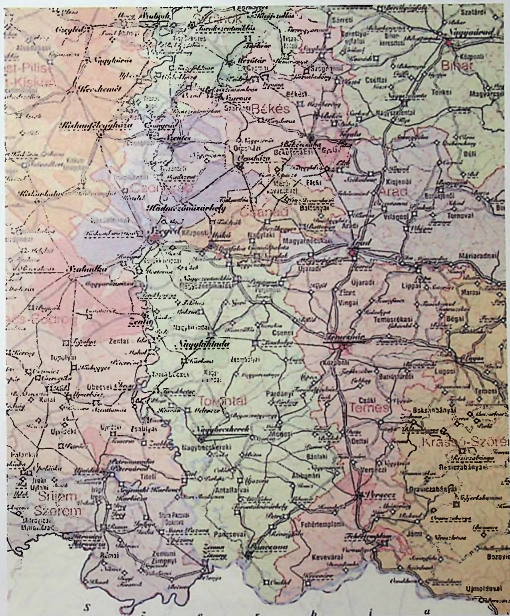
A régió térképe a XX. század elején