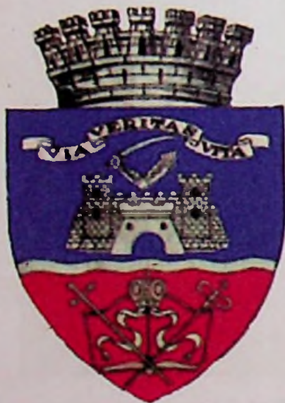
Arad mai címere

Ennek köszönhetően a nemzeti kisebbségek is ismét lehetőséget kapnak saját szervezetek létrehozására, saját anyanyelvű oktatásra, saját anyanyelvű újság kiadásra, államosított intézmények visszaigénylésére.