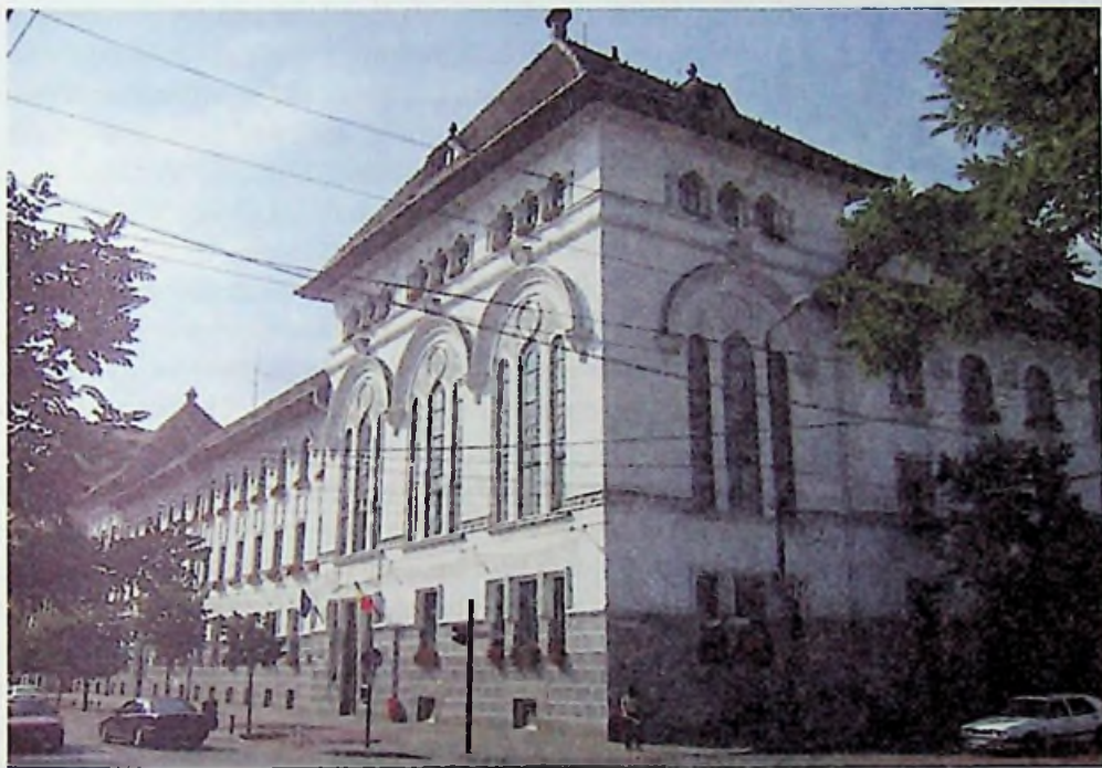
Temesvár - városháza

A mai városháza épületét a Felső-Kereskedelmi Iskola részére tervezték és kezdték el építeni. Az épület 1914-1929 között készült el. Az új román városvezetés ide költözött be, miután 1919. augusztus 3-án bevonult a román királyi hadsereg, Virgil Economu ezredes vezetésével és a román közigazgatás átvette a várost.