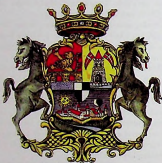
Temesvár régi címere

Stratégiai helyzete miatt – innen ellenőrizni lehetett a Bánsági síkság nagy részét – mind Temesvár, mind Temes vármegye szerepe az idők során egyre