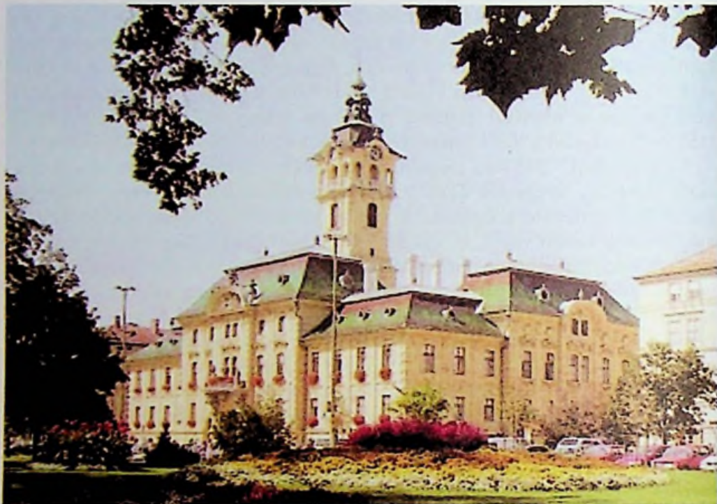
Szeged - városháza

szőregi uradalomból kialakuló Újszeged valamint Tápé falu. A csanádi püspök egyházmegyéjének székhelyét akarta kialakítani a városban, majd Temesvárra költözött, így megszabadult a település a főpap fennhatóságának veszélyétől. A XVIII-XIX. századi várostörténetben arisztokraták alig kaptak szerepet, érdekes kivétel a Kárász család, gazdagságuk alapja lett egy Szeged elől megszerzett uradalom.