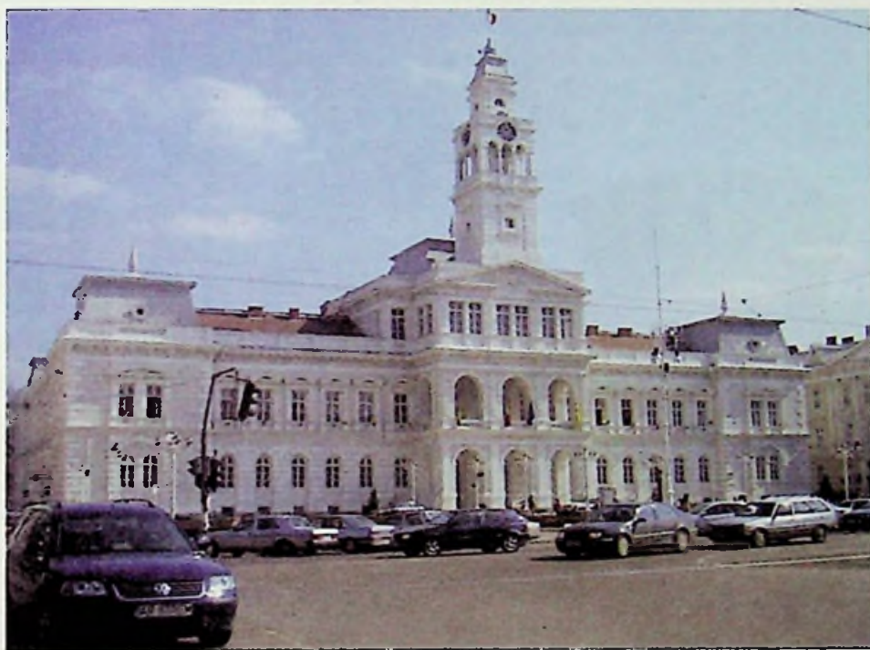
Arad - városháza

Arad ma is jelentős ipari központnak számít, érdeemes bővebben foglalkozni az aradi ipar múltjával. Az ipari forradalom aztán a XIX. század végén a városoknak egy újabb, roppant erős csoportját emelte fel (Nagyvárad, Szatmárnémeti, Temesvár, Szabadka, Marosvásárhely mellett kiemelt helyen említendő Arad). Ezekben a városokban, tehát Aradon is a városképet az eklektika és a szecesszió formálta. Több jelentős „városkettős” jött létre, ezek közül számunkra külön érdekes Temesvár és Arad. Arad gazdasági szerepkörét tekintve az ország vezető városai közé emelkedett (Budapest és Zágráb után a város pénzügyi intézetei rendelkeztek a legnagyobb betétállománnyal az országban), az egy főre jutó banki vagyon terén Arad a harmadik volt az országban (Nagyszében 5.858 korona/fő, Budapest 5361, Arad 1824, Temesvár 1526, Nagyvárad 1117, Kolozsvár 824). A XX. század kezdetén is működött az 1869 októberében beindított (és 1913-ig folyamatosan közlekedő) lóvasút. 1908. július 20-án megalakítják az országban az első autóbusz vállalatot.