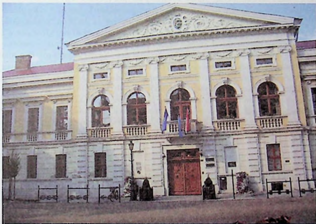
Gyula – városháza

Gyula egyik leglátogatottabb nevezetessége és az egyik legszebb épülete, az Erkel tér sarkán álló egyemeletes, empire stílusú polgárház, melyben az ország második legrégebbi cukrászdája, az 1840 óta működő híres Százéves cukrászda található. Itt a helyi különlegességek elfogyasztása után érdemes megnézni az egyedülálló cukrászmúzeumot és a Simonyi Imre emlékszobát. A szomszédos Ladics-házban pedig egy, a XIX. és a XX. századi előkelő vidéki polgár életét bemutató kiállítást tekinthet meg a városba érkező turista.