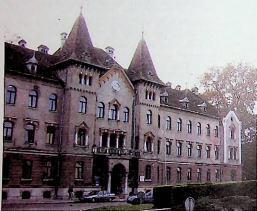
Lugos – városháza

Külön említésre érdemes a színész Lugosi (Blaskó) Béla, Drakula meg- személyesítője, aki által a város neve a hollywoodi filmkockákra is felkerült.