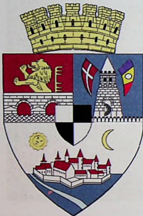
Temesvár mai címere

rész ugyancsak két részből áll. A címer felett hét torony található, amely a hét román tartományt szimbolizálja. Baloldalt felül, vörös alapon hullámok láthatók, amelyek felett egy kettős boltozott nyílású, faragott aranyhíd ível (Traianus hídja), amely felett aranyoroszlán látható. Jobboldalon felül egy kőtorony található kettős erkéllyel (a vár régi víztornya), az emeleten két kerek ablakkal, a földszinten kapuval, amelyen belül egy fekete vaskerek látszik (vízimalom jelképe).